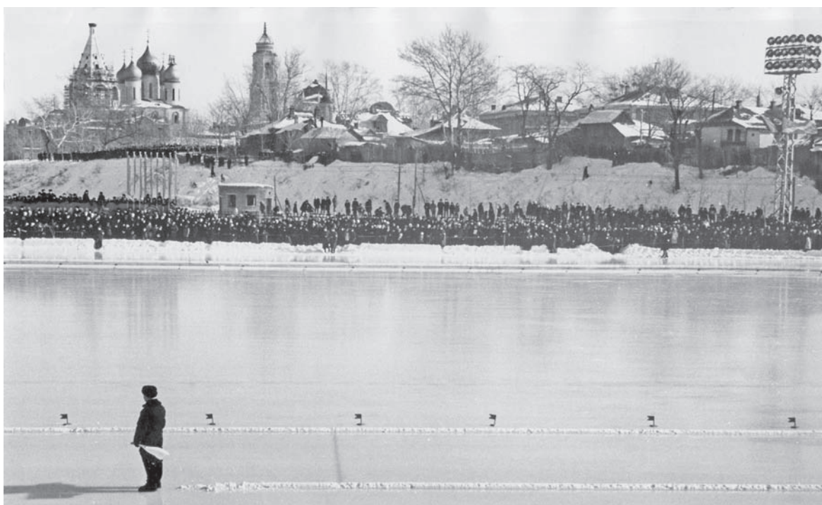
1962 год, Чемпионат РСФСР среди мужчин.

Освещение было прекрасным. 22 января 1961 года на новом стадионе состоялись первые региональные соревнования – первенство Московского областного совета ДСО «Труд». В нём участвовали спортсмены из 15 подмосковных городов. В командном зачёте скороходы Коломны были вторыми, усту-