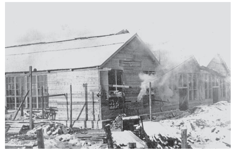
Сборочный цех № 10, построенный из пилломатериалов вскоре после прибытия оборудования из Коломны. Зима 1942 года.

Трудоёмкость изготовления миномёта была сокращена на