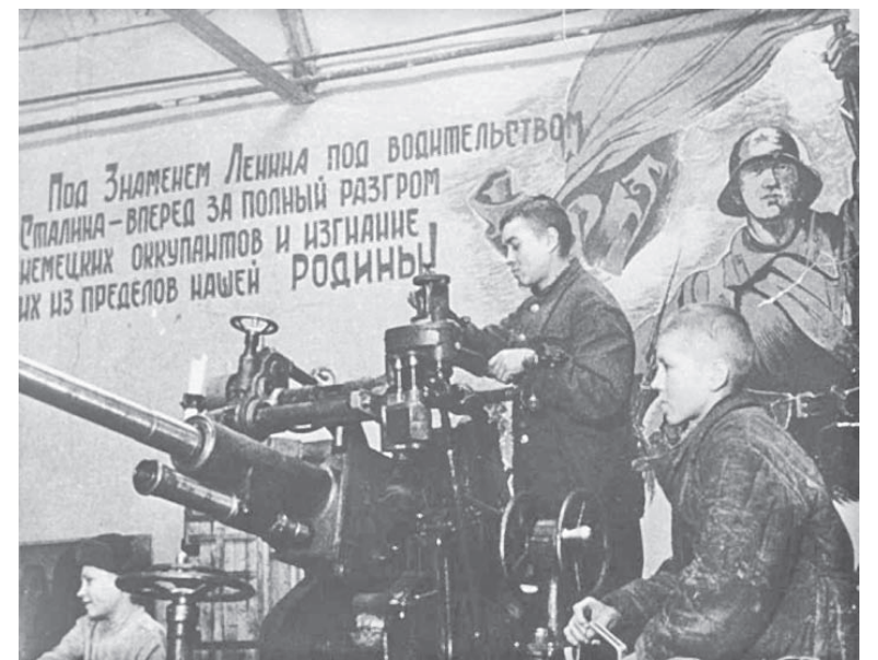
В сборке 37-мм зениток активное участие принимали эвакуированные из Коломны учащиеся ремесленного училища.

44%, расход материалов на 26%, было уменьшено количество оснастки, инструмента и др. В целях сокращения времени на разворачивание изготовления миномёта Нарком во-