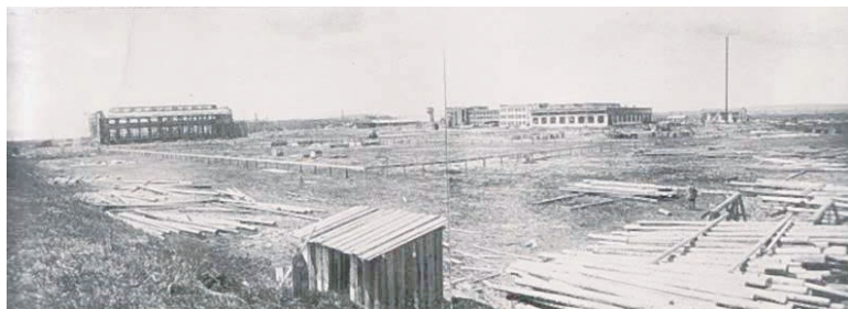
Панорама Красноярского машиностроительного завода (г. Красноярск).

издал приказ об окончании эвакуации, что новым местом для продолжения производства стала база небольшого механического завода в Красноярске, изготавливавшего до войны угольное оборудование. На момент прибытия Коломенского гиганта в Красноярск местный завод имел около 300 металлорежущих станков. К тому же, его металлургические цехи находились в зачаточном состоянии, отсутствовала возможность выполнять термические и штамповоч-