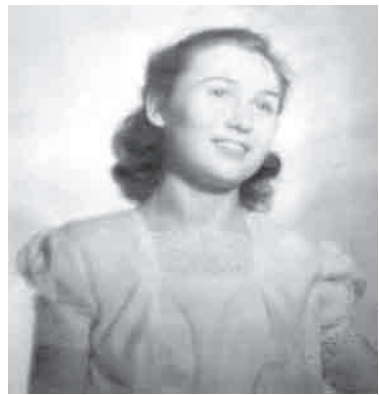
«Мне 18 лет».

мия музыки имени Гнесиных только что отметила 125-летие, а Светлана Николаевна, как известно, выпускница академии. Дом, построенный мужем, у неё такой большой и просторный, что чёрный рояль, стоящий в зале, подаренный хозяйке, как я узнал позже, фирмой «Петров» из Чехословакии, совсем не съедает пространства. Зал велик. В нём всё располагает к большим компаниям – глубокие кресла, длинный стол, стулья, диван. Интерьер зала напоминает музей. Его убранство,